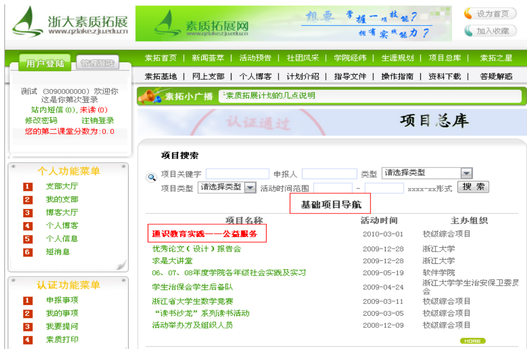
图 9 通识教育实践——公益服务

2、进入后会出现如下图所示项目详情表格，请确认自己是否符合申请要求。确认后，请点击下方“申请”选项（图 10）。