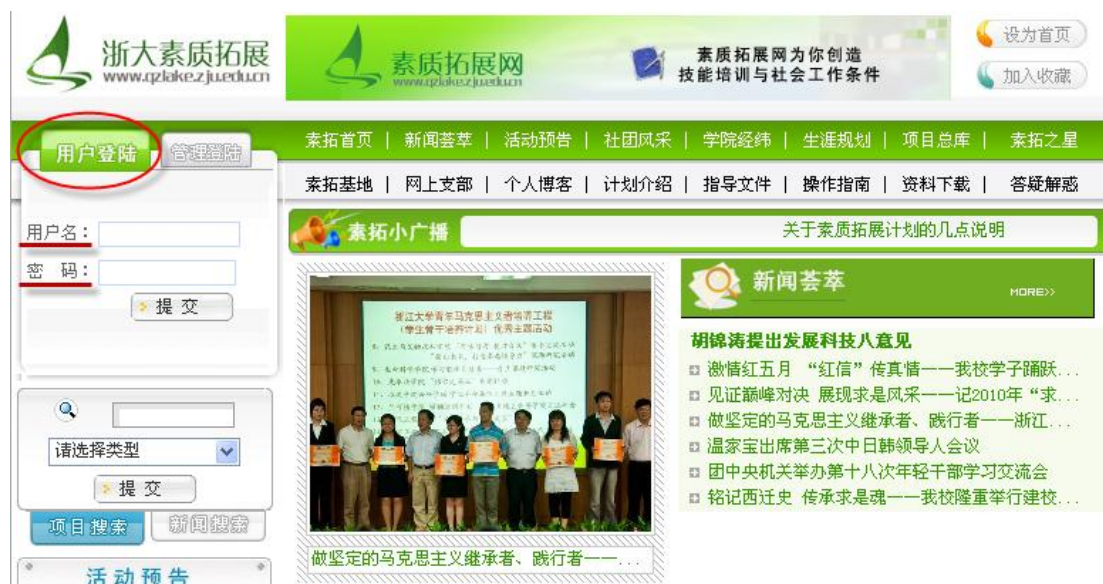
图 4 网站登录界面

1、进入浙江大学素质拓展网 www.qzlake.zju.edu.cn (图 4)，在用户登录窗口，以学号和初始密码 123456 登录。