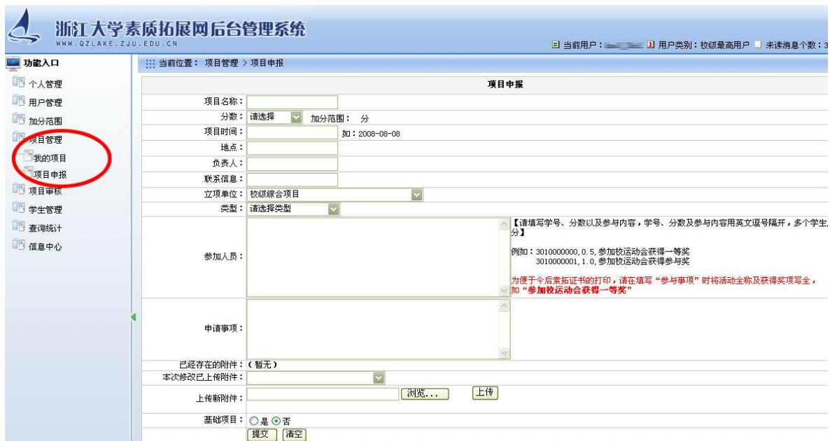
图 13 项目申报

2、要进行项目立项，依次选择“项目管理”——“项目申报”，在右侧窗口中填写该项目的相应情况，按要求将每一项填写完整（特别注意网页红字部分的说明）并上传证明材料，确定无误后点击确定提交即可。（图 13）