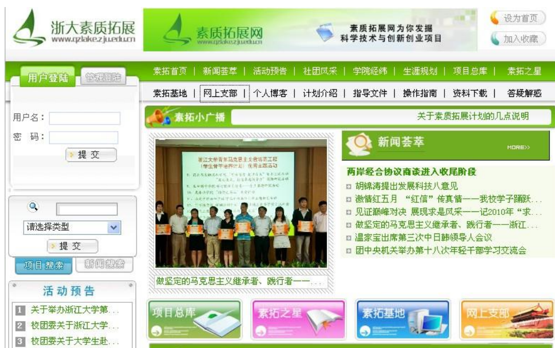
图 1 大学生素质拓展网

中的信息发布、咨询指导、网络认证以及学生素质展示的工作，专业水平位于全国高校前列，2006年荣获“十佳高校学生网站”称号。