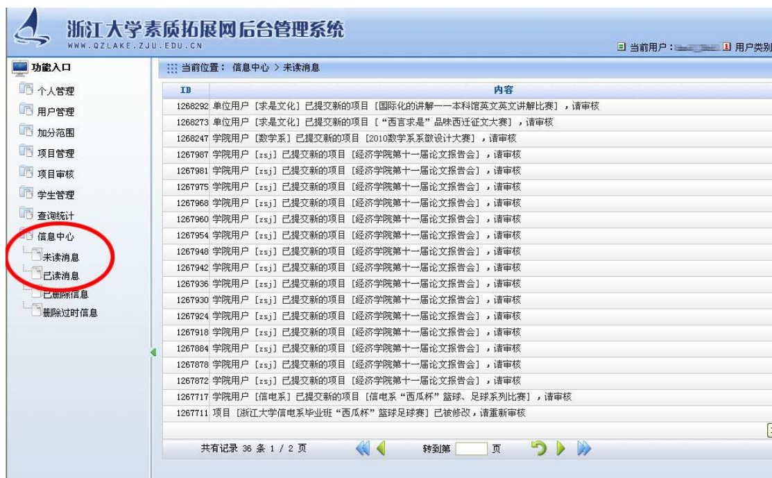
图 14 信息中心

审核一次，对于提交正常的项目可在一周内得到回复。左侧“信息中心”（图 14）可看到审核结果和回复。