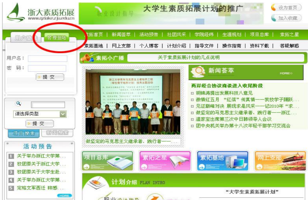
图 12 单位项目立项登录

2、要进行项目立项，依次选择“项目管理”——“项目申报”，在右侧窗口中填写该项目的相应情况，按要求将每一项填写完整（特别注意网页红字部分的说明）并上传证明材料，确定无误后点击确定提交即可。（图 13）