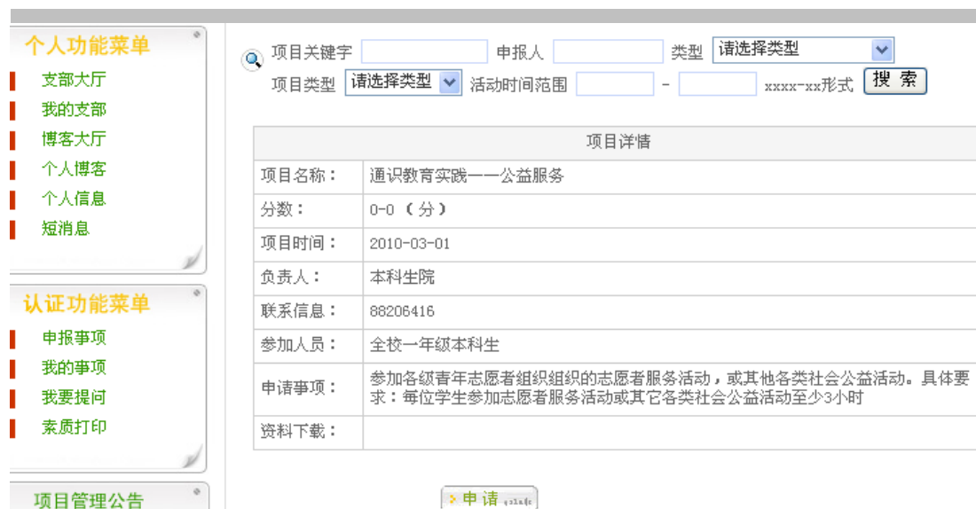
图 10 申报通识教育实践项目

2、进入后会出现如下图所示项目详情表格，请确认自己是否符合申请要求。确认后，请点击下方“申请”选项（图 10）。